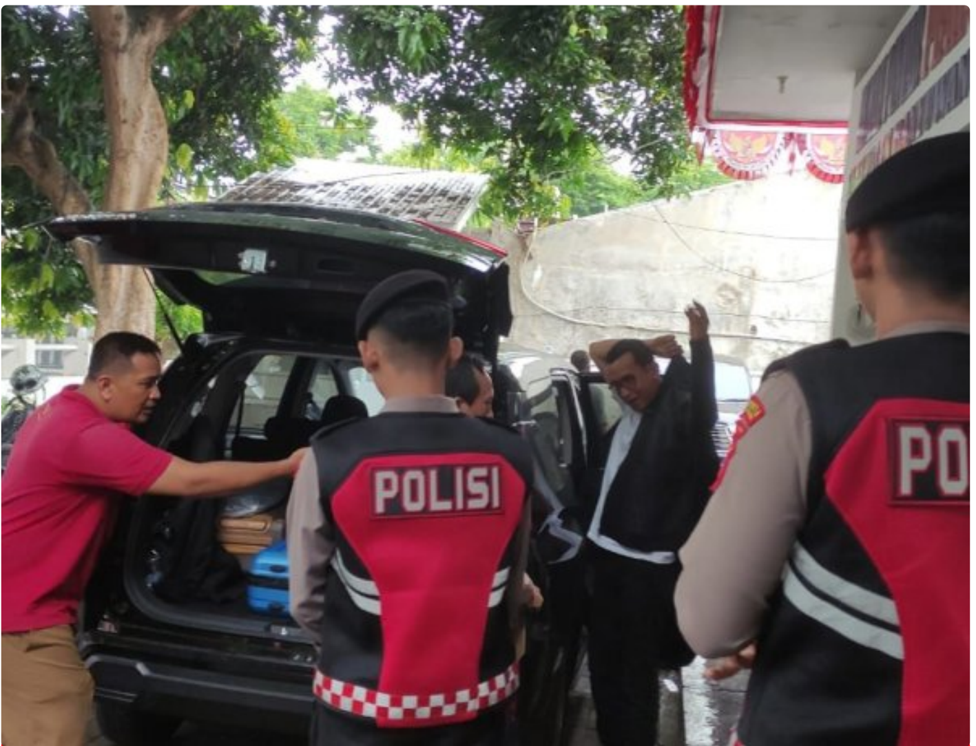
Personel Polresta Banyuwangi melakukan pengawalan ketat proses pengiriman hasil penghitungan surat suara Pilgub Jatim 2024 ke KPU Jatim

BANYUWANGI – Polresta Banyuwangi memberikan pengawalan ketat proses pengiriman hasil penghitungan surat suara Pilgub Jatim 2024 dari Kantor KPU