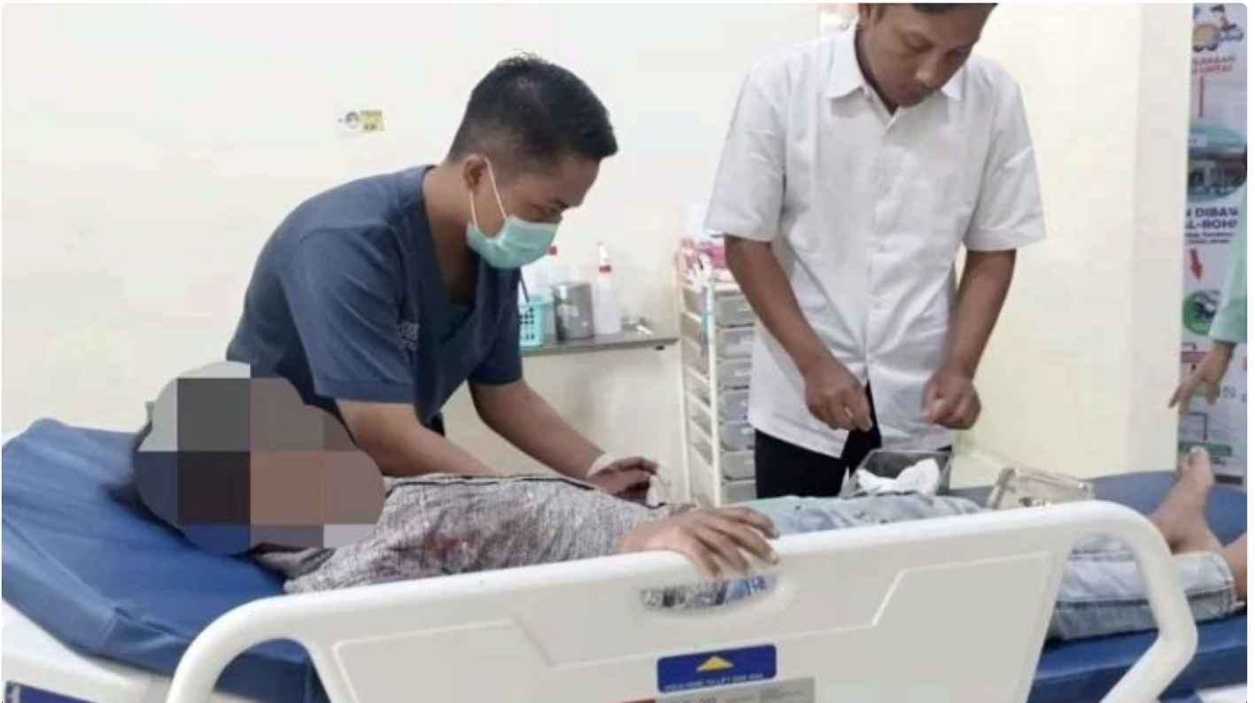
Korban mendapat perawatan dari tenaga medis

BANYUWANGI - Bocah berusia 10 tahun dikabarkan mengalami luka parah usai terkena ledakan petasan. Peristiwa itu terjadi di Dusun Pasembon, Desa Sambirejo, Kecamatan Bangorejo, Kabupaten Banyuwangi, Jawa Timur, Jum'at (29/3/2024) siang.